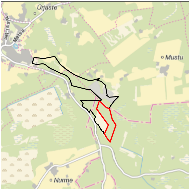
Kaardileht nr 6313 Märjamaa, 6331 Keila